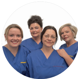
Pflege- und Arzthelferinnen