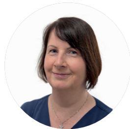
R. Wolf Angehörigenbetreuung

Ein Aufenthalt auf der Intensivstation ist für alle Beteiligten eine herausfordernde Zeit. Wir möchten Sie in dieser Phase unterstützen und Sie in dieser Broschüre über Abläufe und Gegebenheiten auf der Intensivstation vertraut machen.