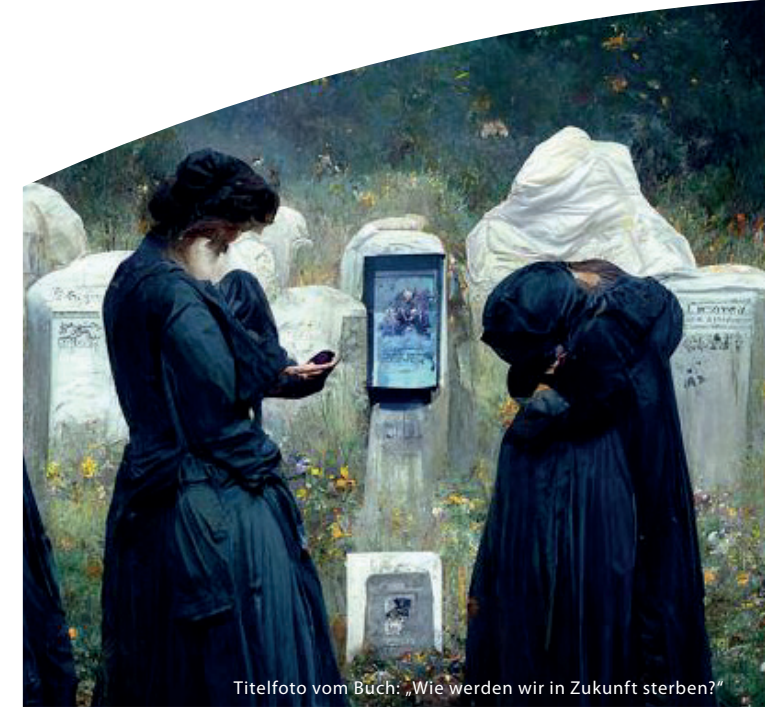
Titelfoto vom Buch: „Wie werden wir in Zukunft sterben?“